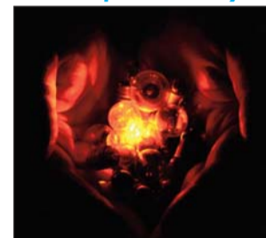
Ольга ІЛЬЧЕНКО (СООП) — «Світлячок»