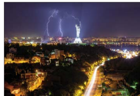
Роман БАК (НАЕК) — «Гроза на Печерську»