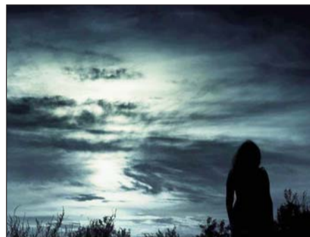
Приз глядацьких симпатій у Юлії МАМЧИЧ (НАЕК) — «Природа — це вічне життя, становлення і рух»