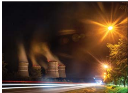
Микола ЄМЕЛЬЯНОВ (РАЕС) — «Атом на службі миру»