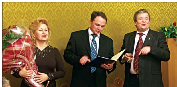
Святковий діалог соціальних партнерів